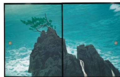
NWM 長野県立美術館 Nagano Prefectural Art Museum http://www.naganobunka.or.jp/